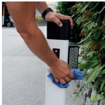
Cura e pulizia raccomandate due volte l'anno